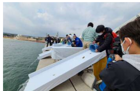
リレー放流に参加した小学生たち