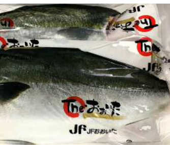
主力商品のプリファイル

1日には、入津湾地区養殖業成長産業化協議会を開催し、水産基盤整備事業の助成を受けられるために必要な「養殖業成長産業化推進基盤整備事業基本計画」を策定した。