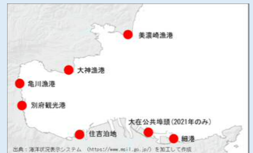
図2 ミズクラゲ浮遊幼生調査地点

今年度も大在公共埠頭を除いた6地点(図2)で12月から調査を始めています。2月上旬までの調査の結果(表1)、今回、12月中にエフィラは出現せず、1月に入ってから出現が確認され始めましたが、別府湾全地点のエフィラの平均分布密度は前年度に比べ高い値で推移しているのが少し気になります。