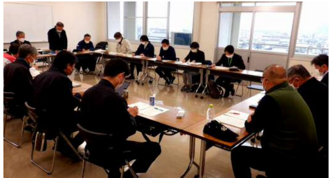
取組を協議する関係者