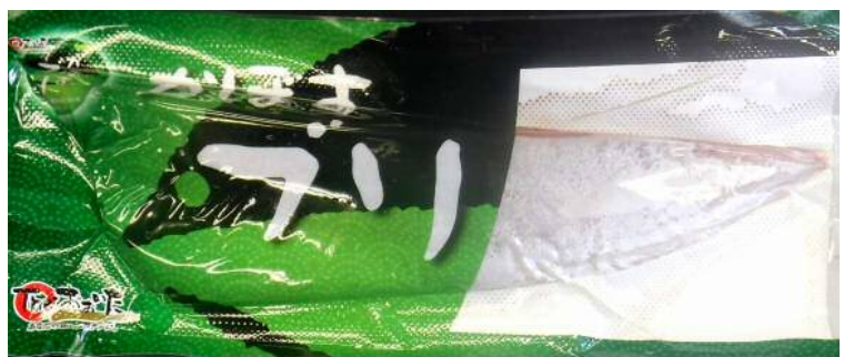
新加工場ではスキンレスロインなどマーケットが求める高次加工に対応する

新加工場による安定的な収益の確保は、早期指導先による改善計画を達成するための重要な骨子であり（150号参照）、組合員理解と協力をお願いしたい。