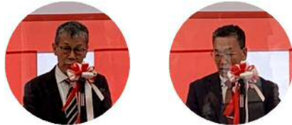
(上)主催挨拶をする広瀬知事 (下)来賓挨拶をする廣野部長と中根組合長