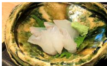
かぼすヒラメの刺身