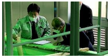
(上)完成した「生産棟A」(下)マコガレイ種苗と視察する広瀬知事

3年度に着工した生産棟Aが完成し、本年1月から育成が始まった。閉鎖循環式システムや緑色LED等の最新の技術が取り入れられ、高低差が付けられた水槽間ではサイホンで種苗が移送できるなど省力化も図られた。生産能力も2割アップするとともに、漁業者の要望が強いキジハタ(アコウ)の種苗生産にも取り組むとしている。