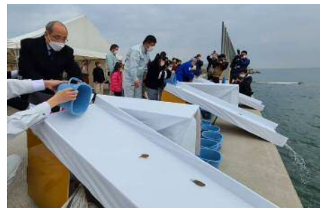
マコガレイを放流する広瀬知事