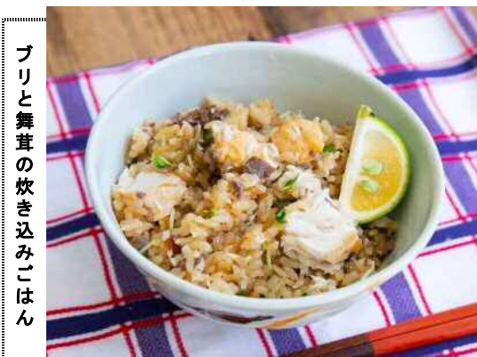
プリと舞茸の炊き込みごはん

み千円以上を購入して応募した方を対象に、県産品が当たるプレゼント企画もあり好評だった。また店内では、県漁協が料理家の栗原心平さんと共同開発した「レシビ」プリと舞茸の炊き込みごはんも提案した。