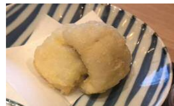
杵築ん鱧の素揚げ