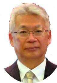
大分県農林水産部長