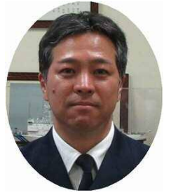
大分海上保安部長