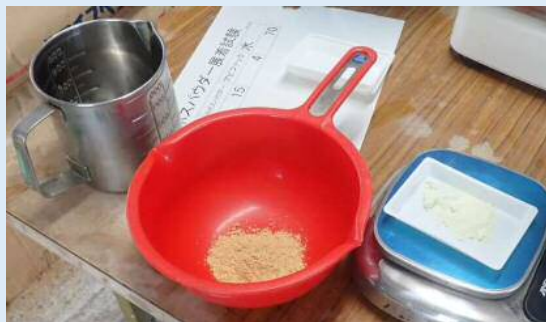
改良型かぼすパウダー 展着剤

試験の成功によって、EPかぼすブリを生産することができるようになれば、これまで以上に効率よくかぼすブリが作成できるようになり、さらなるかぼすブリの生産拡大が期待されます。引き続き、水産研究部へのご協力を賜りますよう宜しくお願いします。