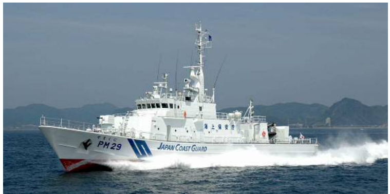
PM29 やまくに (総トン数335トン)