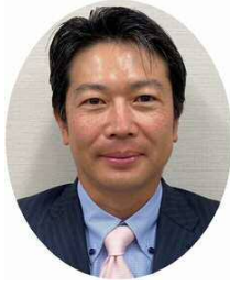
農林中央金庫 福岡支店長