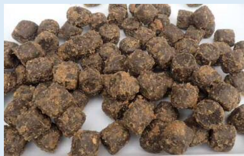
かぼすパウダーを展着したEP