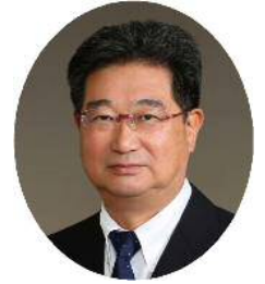
全国漁業協同組合連合会 代表理事長