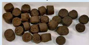
かぼすオイルを浸透させたEP