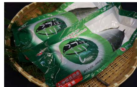
かぼすブリ皮つきファイル・真空・冷蔵

「生でも臭くなく、火を通してもしつとりしていて、よく考えられた養殖ブリ」など高評価だった。消費者の声では、20代女子から臭くないと好評、50代常連からカボスの香りに対する高い評価などが聞かれた。インスタのリアル動画の再生回数もかなり多かったとのこと。