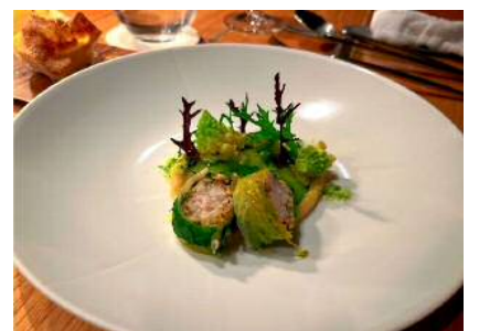
インポルティエノ(Ristorante fanfare)