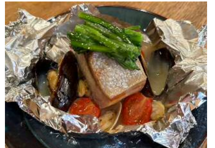
ホイル焼き(ケゴマチコモン)