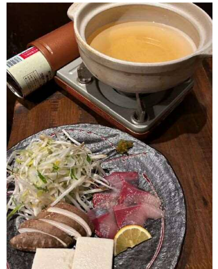
ブリしゃぶ(豊後炊き肉とお晩菜いっしょう)