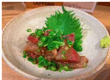
りゅうきゅう(大玖)