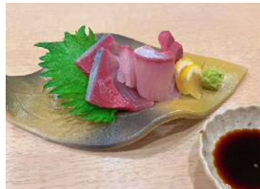
刺身(やつがい処 惣家)