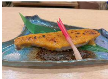
柚子味噌焼き(やつがい処 惣家)