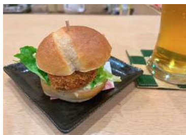
ブリカツバーガー(やつがい処 惣家)

フェア終了後に店舗ヒアリングを行った結果、養殖ブリ類の代替として需要があり、店舗及び消費者ともに品質への評価は高かった。また、皮つきファイルという荷姿は飲食店として最適との評価で、引き続き品質安定への期待が高かった。