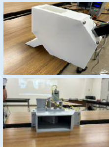
試作中の自動給餌器

平成30年以降、本県の養殖ヒラメ生産量は日本一を維持しているが、養殖業の作業工程はほぼ手作業に頼っているため、労働生産性が低く、魚価向上の取組や規模拡大が困難な状況である。そこで当研究部内に現場再現のための試験養殖施設を整備し、自動給餌機、赤潮センサー等を用いたスマートシステムを構築し、省力化による作業の負担軽減及び生産規模の拡大を図る。