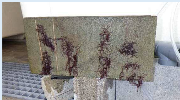
建材ブロックに着生させたテングサの人工種苗

これまでに当グループが確立したヒジキやテングサ等の種苗生産技術で作出した人工種苗を活用して、県内各地で増養殖に取り組んできました。しかし、沖だし後の成長が思わしくなかったり、食害による減耗などの課題がみられたことから、種苗生産の技術を安定的かつ大量にできるようさらに検討を行うとともに、食害防除の手法など現地での効果的な増養殖手法の開発に取り組んでいます。